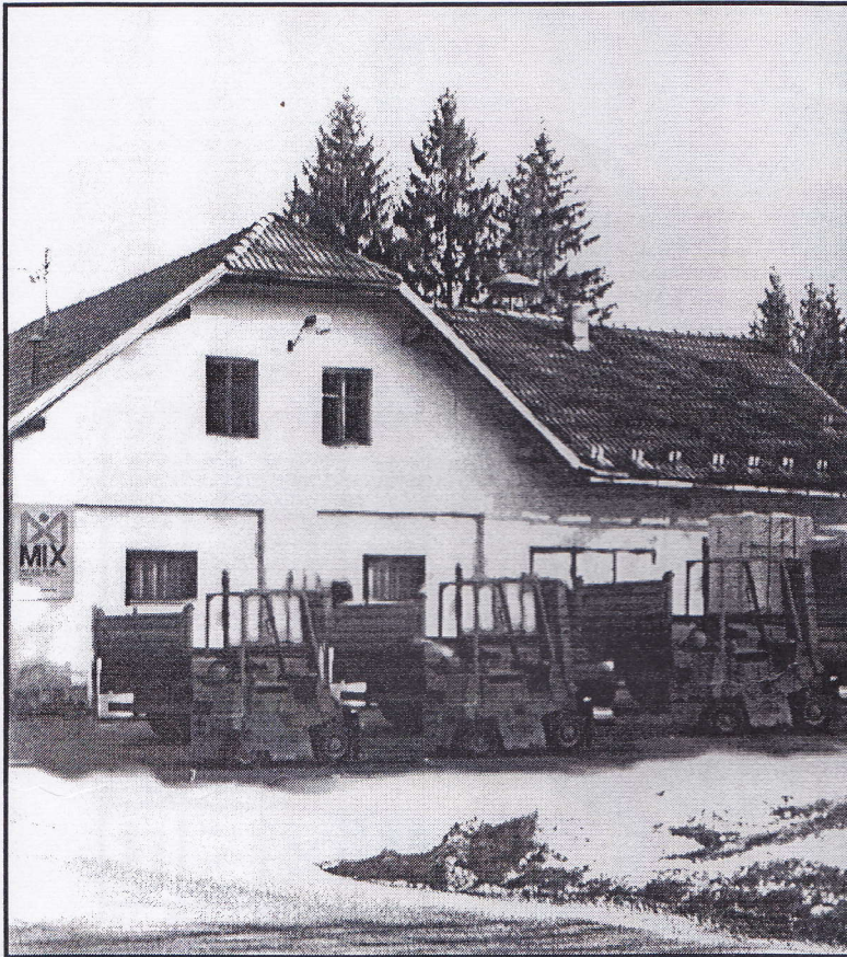
Viličarji namesto Robija