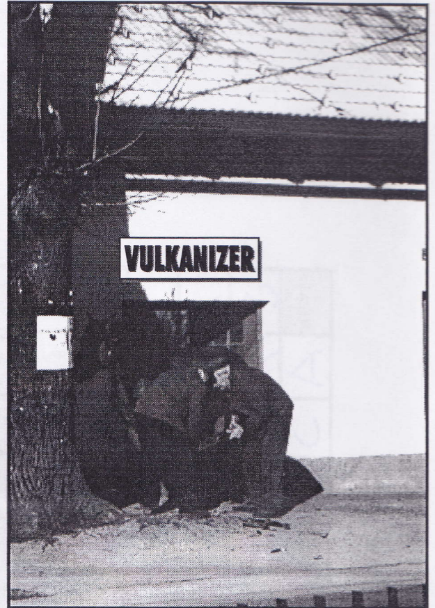
Konjski vulkanizer - konkurenca Gumi d.o.o.