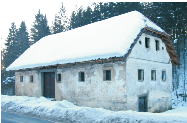
Kaj se je v resnici dogajalo za zidovi HE?

Ali naj tej razlagi verjamemo ali ne, pa je še drugo vprašanje. To pa je še tema za kdaj drugič.