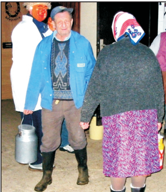
Razjarjeni kmetje se vračajo s polnimi kanglicami