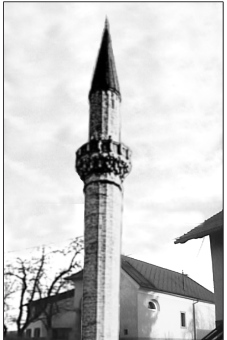
Cerkev po lanskem terorističnem napadu je obnovljena