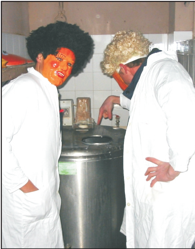
Inšpektorja HU-ZPP med jemanjem vzorcev