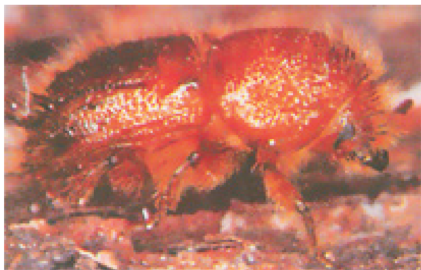
Šesterozobi smrekov lubadar ( Pityogenes chaalographus )

Obema se zdi stvar zelo čudna in priznavata, da se s takim ali podobnim primerom še nista srečala, čeprav se z gozdarstvom e zelo dolgo ukvarjata. Razlo ıla sta nam, da poleg več vrst smrekovega in jelovega lubadarja pri nas obstaja še borov lubadar, za macesnovega pa nista še nikoli slišala. In . Indihar je malo posumil na macesnovega molja, vendar je, ko smo mu ivalico pokazali, to takoj zanikal. Preostane nam edino čakanje na rezultate iz avstrijskega laboratorija. Tako boste šele v naslednjem časopisu izvedeli, zakaj so pri Tombi na macesnih odpadle vse iglice.