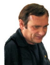
EDO DELA NAPREJ