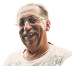
Za skupno dobro kandidaturo podpira PGD Jalta

Priprave na volitve v organe PGD Ponikve so že v polnem teku in za vodilna mesta se je vnel krčevit boj.