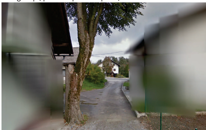
Fotografija, posneta pred Francetovo domačijo

Slika spodaj desno: priča smo demonstraciji večšine uravnovešanja voza pri nalaganju z lesom ali pa se je Muhovec odločil, da ima doma preveč drv in jih je odpeljal nazaj v gozd.