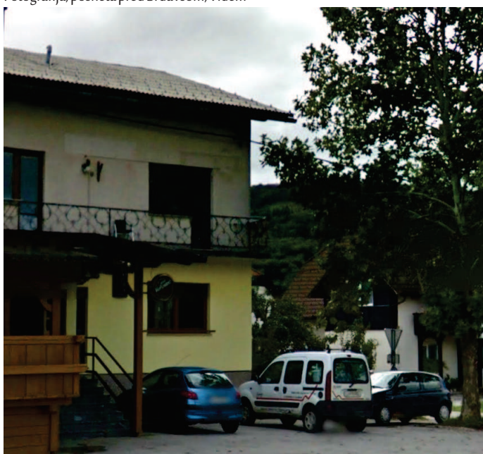
Fotografija, posneta pred Majolko, Videm