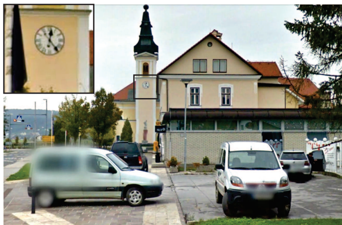
Fotografija, posneta pred Brdavsom, Videm